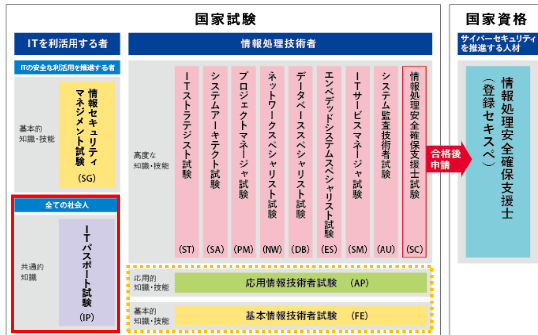
図 情報処理技術者試験・情報処理安全確保支援士試験の試験制度区分一覧 ▶ （注）独立行政法人情報処理推進機構（IPA）のHPから引用