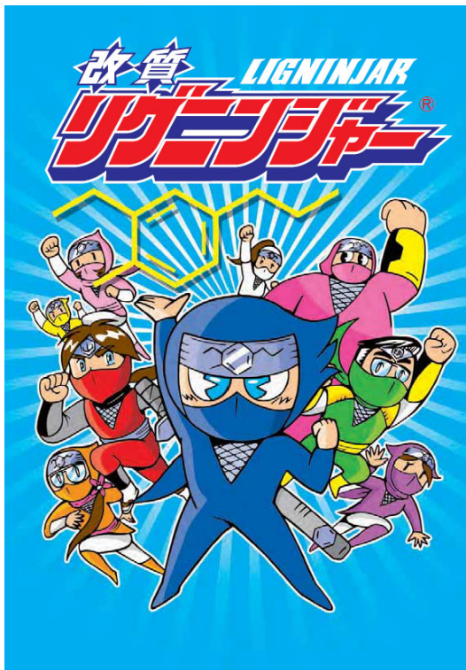
図1 改質リグニンのオリジナルキャラクター